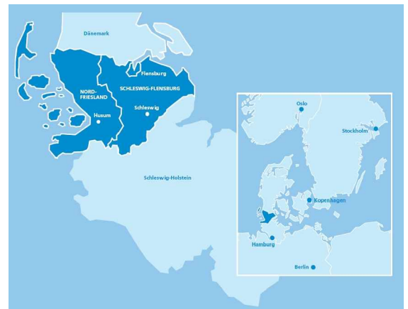
Die Lage der Gesundheitsregion NORD

Ziel der Gesundheitsregion NORD ist die Bildung einer Gesundheitsregion, in der durch zielgerichtete Vernetzung der Akteure langfristig die Gesundheit und damit auch die Lebensqualität der Bevölkerung verbessert und gleichzeitig die wirtschaftliche Entwicklung in der regionalen Gesundheitswirtschaft befördert wird. Die Gesundheitsregion NORD verfolgt dieses Ziel in ihrem Wettbewerbsbeitrag mit der Entwicklung regionaler Patientenpfade quer durch alle Sektoren der Gesundheitswirtschaft . Dieser Ansatz ist bundesweit einmalig und ein innovativer Beitrag zur patientenorientierten Vernetzung des Gesundheitswesens.